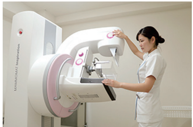
マンモグラフィ検査を行う検査技師はすべて女性です