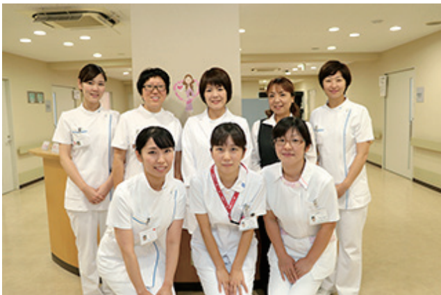
女性スタッフがお待ちしています

乳がん専門医による家族性乳がん(遺伝による乳がん)のカウンセリングを行っています。 ご希望があれば家族性乳がんの遺伝子検査も実施しています。